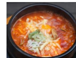
チーズ海鮮純豆腐チゲ (ライス・キムチ付き) 1,550円