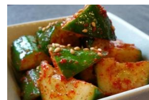
ピリ辛きゅうり 550円