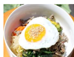
ビビンパ (キムチ・スープ付き) 1,100円