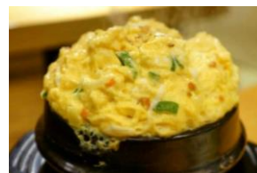
ケランチム 950円 海鮮ケランチム 1,150円