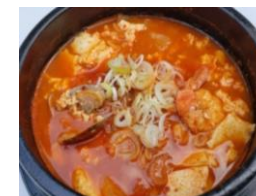
海鮮純豆腐チゲ (ライス・キムチ付き) 1,450円