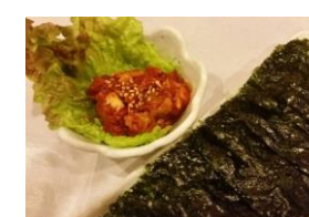
チャンジャ 600円 韓国のり 330円