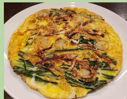
海鮮ネギチヂミ 1,750円