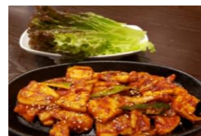
サンギョブサル辛口炒め (サンチュ付き) 1,300円