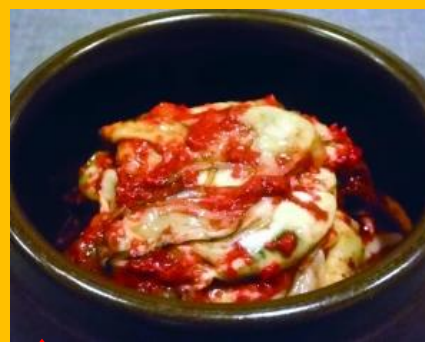
冬限定 生カキコッチョリ 1,650円 生カキ追加 1,100円