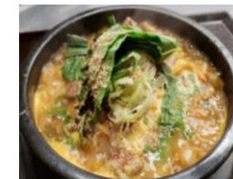
トゥッペギ ウゴジガムジャタン (ライス・キムチ付き) 1,600円