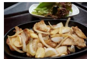
サンギョブサル (サンチュ付き) 1,250円