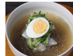
冷麺 (キムチ付き) 1,100円