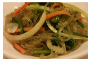
チャプチェ 950円 海鮮チャプチェ 1,150円