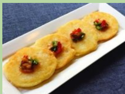
ジャガイモチヂミ 1,100円