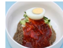
ビビン冷麺 (キムチ付き) 1,100円