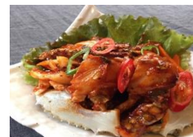
ヤンニョムケジャン 1,550円