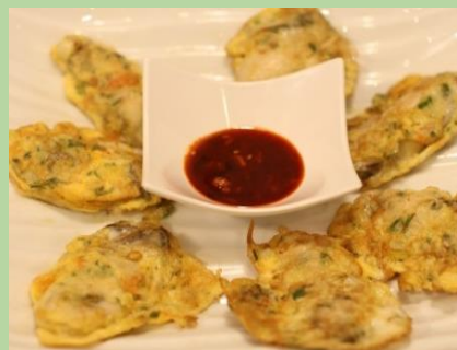
冬限定 生カキジョン 1,650円