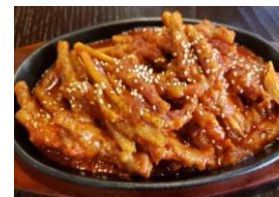
モミジ(タッバル) 1,100円