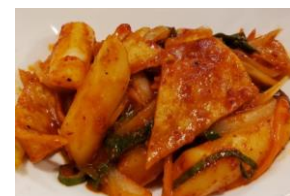
トッポキ 950円 チーズトッポキ 1,150円