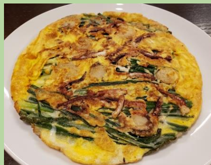
海鮮ネギチヂミ 1,750円