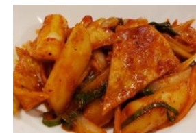
トッポキ 950円 チーズトッポキ 1,150円