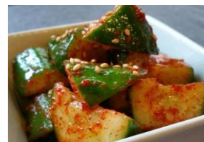
ピリ辛きゅうり 550円