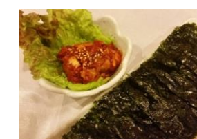
チャンジャ 韓国のみ 600円 330円