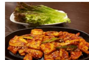
サンギョブサル辛口炒め (サンチュ付き) 1,300円