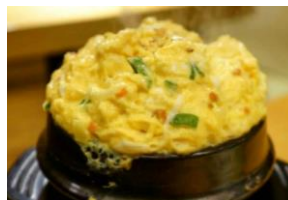
ケランチム 950円 海鮮ケランチム 1,150円