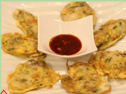
冬限定 生カキジョン 1,650円